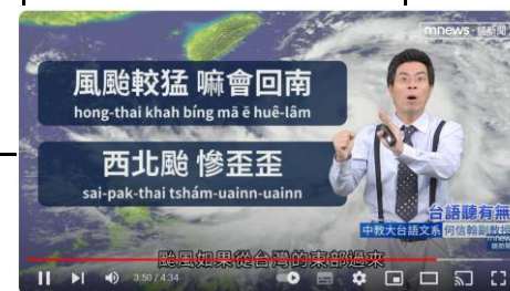
【台語聽有無】颱風相關台語按怎講 | 台語新聞 #鏡新聞