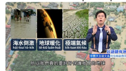
【台語聽有無】水災相關台語按怎講 | 台語新聞 #鏡新聞