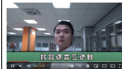
地震保命3步驟「趴下、掩護、穩住」(台語版)